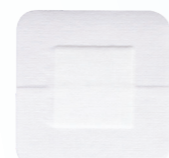
Actolind® Wound Pad Adhesive / Transparent Sterile Wundauflage, hypoallergenes medizinisches Pflaster aus porösem, elastischem Vliesstoff