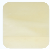
Actolind® Hydrocolloid Hydrokolloid adhesive, saugfähige, wasserdichte Wundauflage

Dank moderner Wundauflagen, bieten wir ganzheitliche Lösungen in der Wundheilung die wir durch unsere klinischen Erfahrungen in der Wundversorgung gesammelt haben.